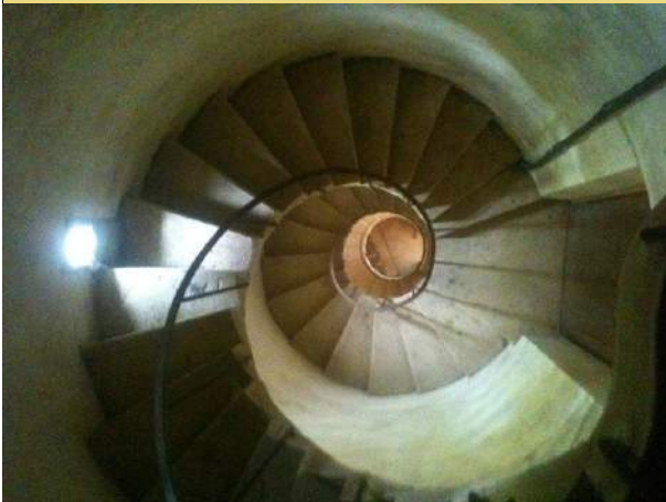
Où se trouve cet escalier ?

Ensemble, nous redécouvrirons le bourg de Bonnay au travers de ses différents monuments et aménagements : église, rigoles, couvent, prieuré, fontaines et lavoir, qui nous rappellent la longue et riche histoire du village.