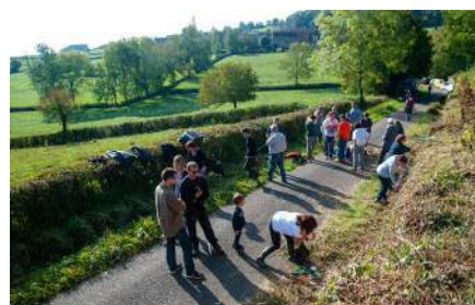
près de 50 personnes avaient participé à l'édition 2014 à Besanceuil

Après le succès du chantier de septembre 2014, où nous avons dégagé le mur d'entrée de Besanceuil,