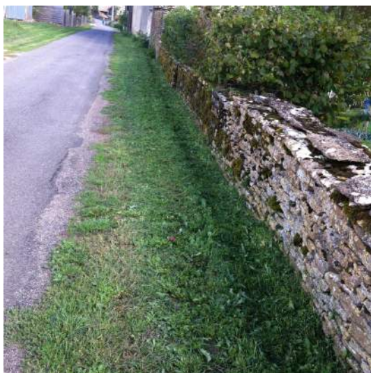
les herbes au bord des routes

L'an dernier, un élu de la commune a participé à un stage obligatoire de deux jours sur l'utilisation des produits phytosanitaires. Le cantonnier, de son côté, étant soumis à la même obligation, va suivre cette formation l'hiver prochain.